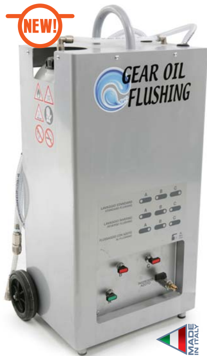
Cod. 02.021.04 GEAR OIL FLUSHING > Apparecchio lavaggio radiatori (per cambi automatici) > Automatic gearbox cooling radiator flusher